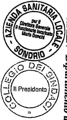
Tavola 2.2.4 - Dipartimento di Prevenzione Medico